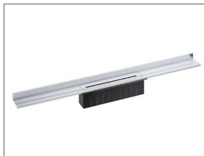
HL-GF Christoph Schütz; Duschrinne WALL Standard